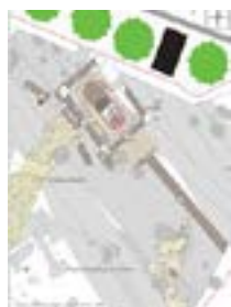
Extrait du plan général de la fouille. R. Pansiot, Eveha