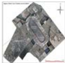
Orthophotographie de l'ensemble hydraulique vidé entièrement, Cliché et D.A.O. R. Pansiot, Eveha