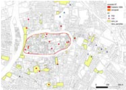
Indices d'occupation de l'Antiquité tardive à Sens. M. Kasprzyk.

mal documentés, en raison ici de l'ancienneté des découvertes, mais on peut écarter qu'il s'agisse d'indices funéraires. On observe que les indices d'occupation se concentrent nettement le long de deux voies sortant de l'enceinte : voie en direction d'Auxerre puis Autun ; voie en direction de Paris. Ce type d'occupation extra-muros non funéraire n'est pas attesté à l'ouest (en direction d'Orléans) et à l'est (en direction de Troyes, où l'on trouve une vaste zone funéraire de l'Antiquité tardive). Une fouille récente en bordure de la voie d'Auxerre donne un aperçu de la nature possible de ces pôles extra-muros.