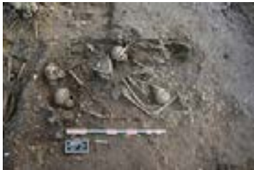
Une des sépultures multiples de la nécropole de l'îlot Castéja à Bordeaux.

Bordeaux, une fouille préventive a été menée en 2016-2017, identifiant une occupation allant de l'époque tardo-antique à l'époque moderne. La nature de l'occupation de ce site a varié au fil du temps. Les vestiges identifiés témoignent d'une occupation continue, mais évolutive, dans ce quartier de marge et éclairent ainsi l'histoire de la fabrique urbaine de Bordeaux. En outre, la zone sud de la fouille a révélé des inhumations de l'Antiquité tardive correspondant à un secteur jusqu'alors inexploré de la nécropole dite de Saint-Seurin. Si une partie des sépultures découvertes s'intègre parfaitement dans la continuité des vestiges déjà connus, l'intervention a permis de révéler la présence d'un ensemble tout à fait original de sépultures multiples relevant d'une crise sanitaire sans précédent.